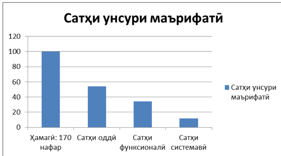
Диаграммаи 3. Худбаҳодидиҳои таълаққули салоҳият ва салоҳиятнокии хонандагони гурӯҳи якум

Дар гурӯҳи якум таҳлили натиҷаҳои бадастомада нишон медиҳад, ки сатҳи оддӣ нисбат ба сатҳи функционалӣ баланд буда, дар навбати худ сатҳи функционалӣ аз сатҳи системавӣ баландтар аст. Яъне, аксарияти хонандагон дар сатҳи истифодабарандагони оддии технологияҳои иттилоотӣ - коммуникатсионӣ қарор доранд, ки албатта такмил ва таҷдидро талаб менамояд. Ба таври умумӣ чунин натиҷаҳо ба даст оварда шуданд: сатҳи оддӣ – 54%, сатҳи функционалӣ 34 %, сатҳи системавӣ – 12%.