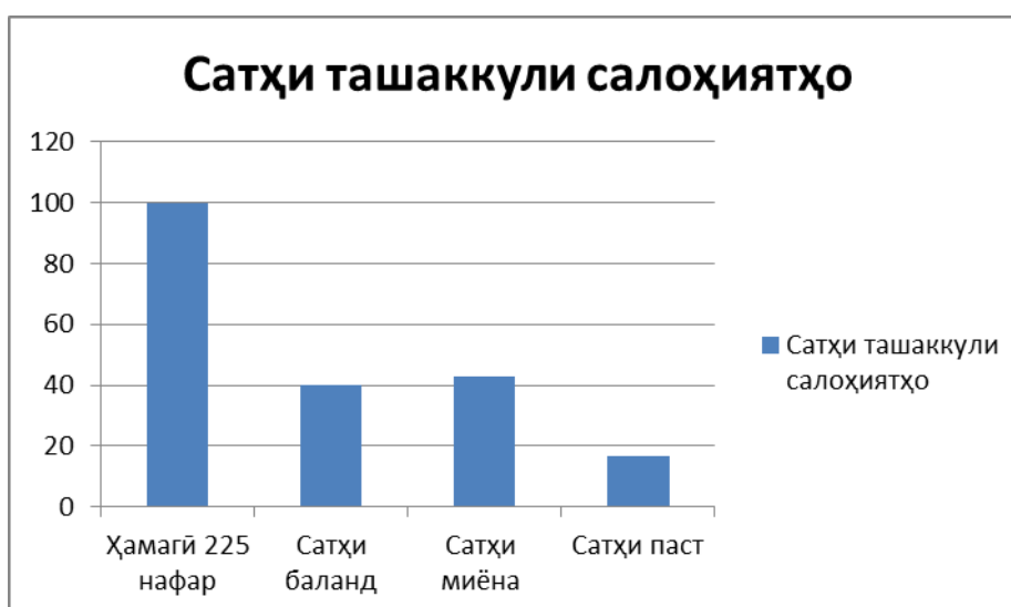
Диаграммаи 2. Диаграммаи ташаккули салоҳият ва салоҳиятнокии хонандагони гурӯҳи дуюм

Дар ҳолате, ки агар аз теъдоди умумии хонандагони синфҳои 10-11-и дар озмоиш иштироккарда 38 нафар ё худ 16,9 % хонандагон сатҳи пастии салоҳиятнокии иттилоотӣ-коммуникатсионӣ дошта бошанду мустақилона натавонанд барномаҳои омӯзиширо истифода намоянд, ин дар маҷмӯъ далели паст будани сатҳи ташаккул ва инкишофи салоҳият ва салоҳиятнокии онҳоро нишон медиҳад.