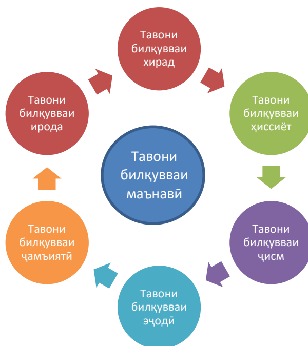
Расми 2. Гули нерӯҳо

Якҷо бо хонандагон коркард кардани гули нерӯҳо ба мақсад мувофиқ аст. Ҳамаи омилҳои инкишофи доимии худинкишофи шахсро қайд кардан лозим аст.