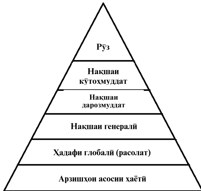
Расми 3. Аҳроми ҳадафҳо

Усули III: «Нақшаи ҳаёти ман». Ба хонандагон пешниҳод карда мешавад, ки аҳром (пирамида)-ро тасвир кунанд (мувофиқи ҳамон усуле (принсип), ки аҳроми Франклин Б. сохта шудааст) бо якчанд сатҳҳо бояд бо тасвиятҳои мӯайян пӯр карда шаванд [124. С. 367-369].