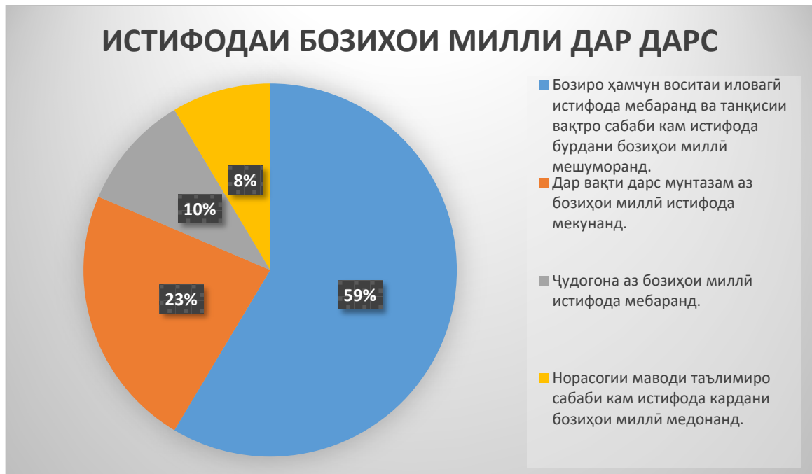
Расми 1. Нишондиҳандаҳои истифодаи бозиҳои миллӣ дар раванди дарс аз ҷониби омӯзгорон

Аммо проблемаи дарсҳои тарбияи ҷисмонии замони муосир дар зиёдшавии бозиҳои ғарбӣ дар раванди дарс ва истифодаи ками бозиҳои миллӣ мебошад. Таҷриба нишон медиҳад, ки аз 100% (60 нафар) омӯзгорони тарбияи ҷисмонӣ танҳо 9 % (5 нафар) дар дарсҳои худ аз бозиҳои миллии тоҷикӣ истифода мебаранд. 10 фоиз (6 нафар) онҳоро ҳамчун тамрини омодагӣ ба дарс дохил мекунанд ва 23 фоиз онҳоро дар қисмати охири дарс истифода мебаранд. Сабаби ин равандро 58% дар душвории фаҳмонидани қоидаи бозӣ мебинанд ва ин вақти зиёдро талаб мекунанд.